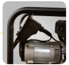
Panel de control inclinado para una fácil lectura