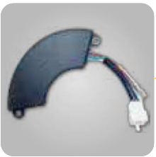
Regulación AVR asegura un voltaje constante