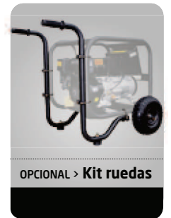
OPCIONAL > Kit ruedas