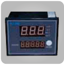
Panel Profesional LED con 4 funciones y diferencial de 30mA con protección por fuga